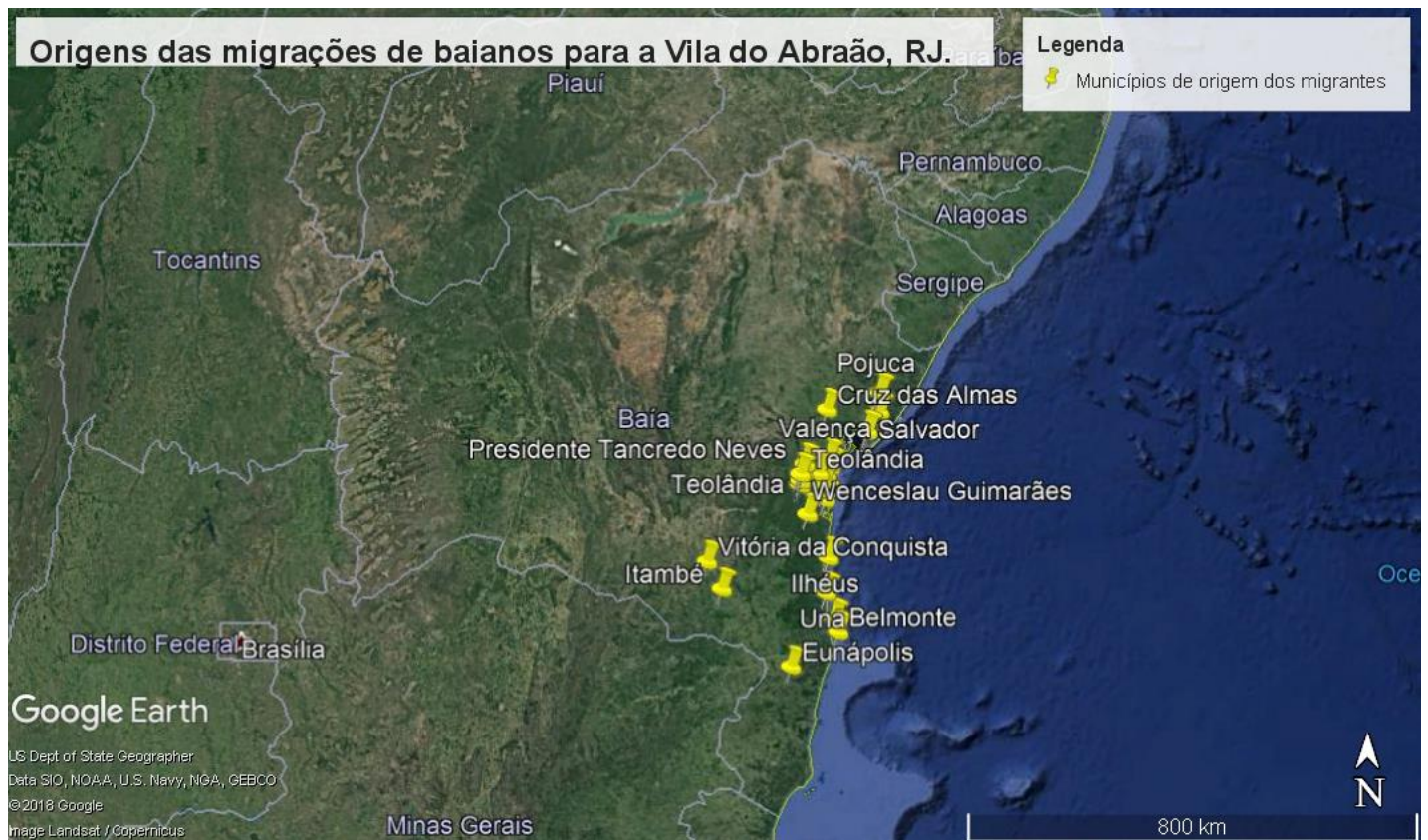
Figura 1- Localização das cidades de origem dos migrantes para a Vila do Abraão

FONTE: Google Earth/ Matrículas escolares da EMBN. Elaborado por: Rafaela Dettogni