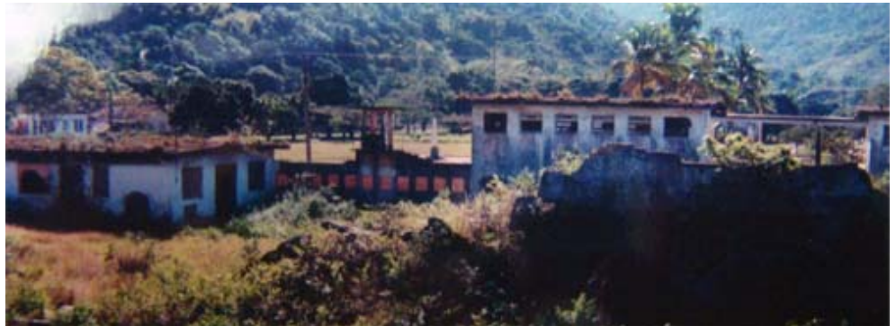
Figura 4: Ruínas da parte interna do IPCM, 1991