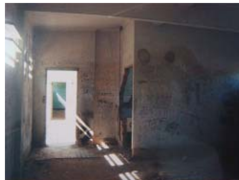
Figura 8: Inscrições nas celas remanescentes do IPCM, 1991