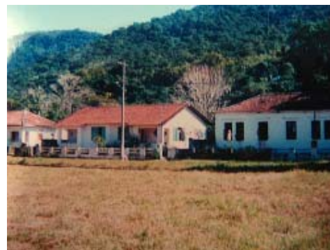
Figura 3: Casas abandonadas na VDR, 1991

dos já existentes (Rubio, 1986 p. 51). No caso do IPCM a mudança é enorme - de casa de detenção a atrativo turístico. Evidencia-se, assim, a importância de coisas efêmeras de ontem; as de hoje podem tornar-se referência para gerações futuras. O olhar das pessoas hoje em relação a objetos e modo de vida do passado é de distanciamento e estranheza. Esse olhar incita o estudo, a investigação do passado. Desassocia-se, então, a idéia de patrimônio ligado a objetos antigos, velhos e mau cuidados (Lowenthal, 1997, p. xxi). Os escombros do presídio permanecem na IG e tornaram-se atrativos para os visitantes que percorrem suas instalações ainda erguidas, perplexos com a situação observada. Os moradores, por sua vez, encaram as ruínas como sendo parte de seu passado que, conseqüentemente, também define (Figura 3).