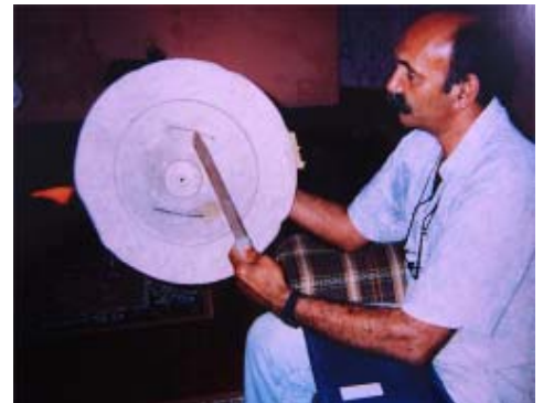
Figura 2: Escudo e estoque fabricados pelos membros do Comando Vermelho, 1991