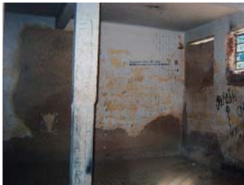
Figura 7: Inscrições nas celas remanescentes do IPCM, 1991

Inscrições de autoria dos detentos do Instituto Penal Cândido Mendes retiradas das paredes da única cela ainda erguida. As transcrições reproduzem fielmente os escritos, mantendo a pontuação empregada, bem como os erros de grafia (Figuras 7 e 8).