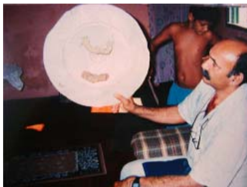
Figura 1: Escudo fabricado pelos membros do Comando Vermelho, 1991

Durante a Revolução Francesa "os monumentos demolidos, danificados ou desfigurados por ordem ou com o consentimento das comissões revolucionárias são-no enquanto expressão de poderes e